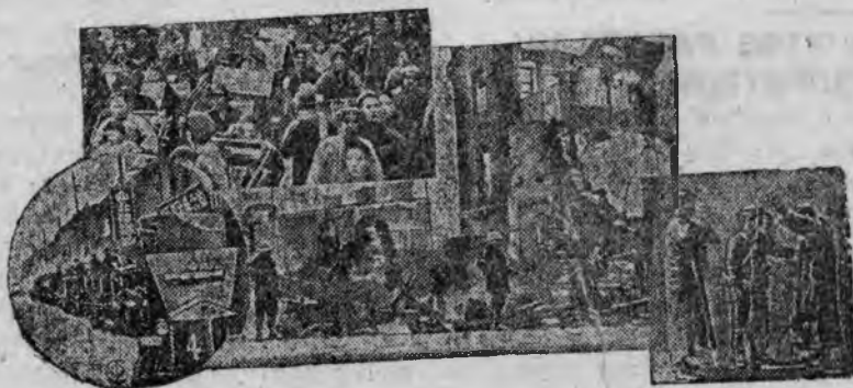
НА СНИМКЕ: Вверху—бегство китайского населения из ЧАПЕЯ в ожидании наступления японских войск. ВНИЗУ—Японские броневики на улицах ХАНЬЮ СПРАВА—обыск китайца японским солдатом на улице. В ЦЕНТРЕ—дома в ШАНХАЕ, разрушенные в результате обстрела их японскими войсками

В Париже и ряде других городов Франции, состоялись организованные компартией антивоенные митинги и демонстрации.