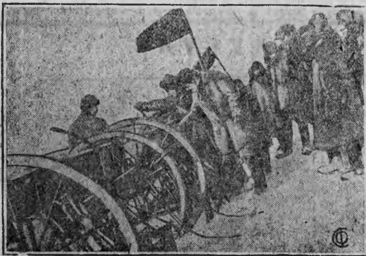
Разовьем взаимопроверку колхозов

НА СНИМКЕ: Смотровая комиссия колхоза им. Шевченко проверяет в колхозе им. Калинина готовность бригад к севу